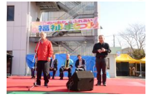
ふれあい福祉まつり