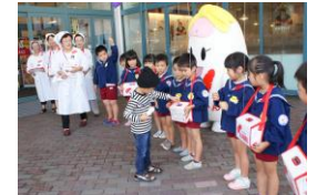
共同募金セレモニー