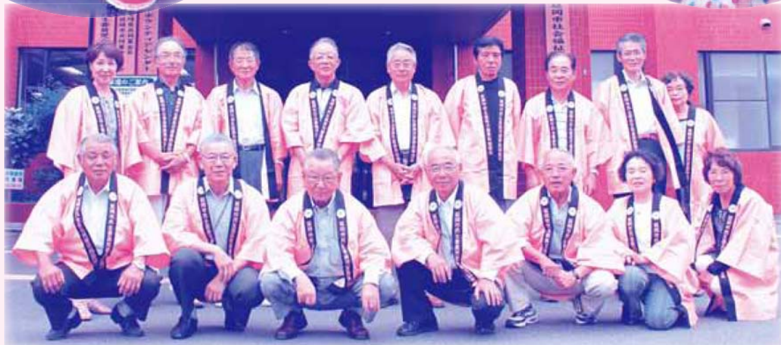
(延岡市民生委員児童委員協議会のみなさん)