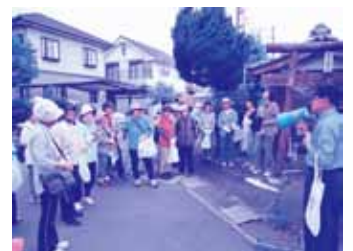
～恒富東地区社協エコウォーキングの様子～