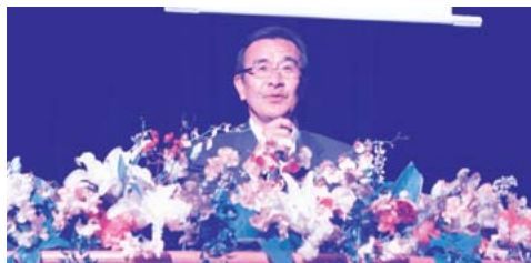
昨年の講演の様子

人と人とがつながる安心・安全な地域づくりを目指して、今年も「みんなでつくろう支え合う地域社会」をテーマに第12回延岡市地域福祉推進大会を開催いたします。