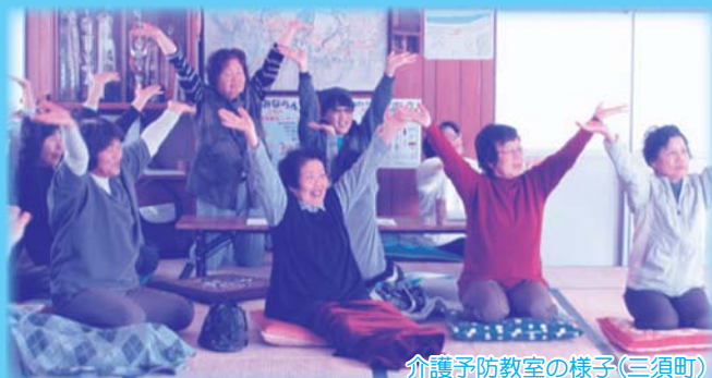
介護予防教室の様子(三須町)