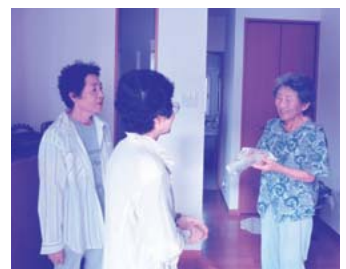
鶴ヶ丘推進チーム活動の様子

地域のボランティア力を活かし、近隣住民で協力し合い、一人暮らし高齢者世帯などへの声掛け・見守り活動をおこなう推進チームの支援を行っています。