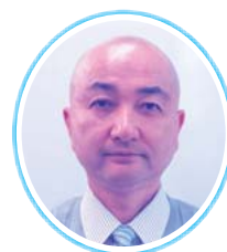
延岡市社会福祉協議会