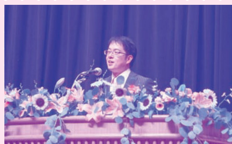
昨年の講演の様子