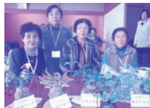
前回はこけ玉づくりを体験しました。