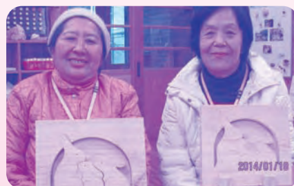
家のどこに飾ろうかなあ?