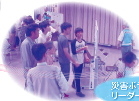
災害ボランティア リーダーの養成に