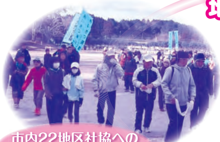
市内22地区社協への 活動費として