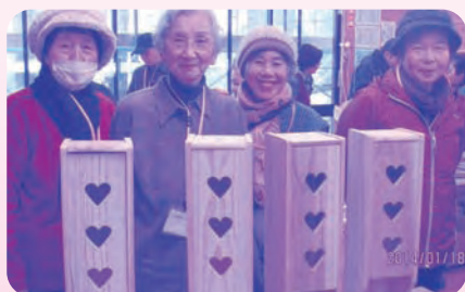
作るのが大変でした! でもいいものことができましたよ。