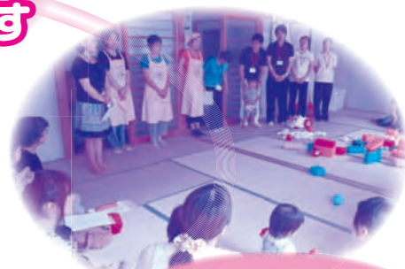
子育て支援のために