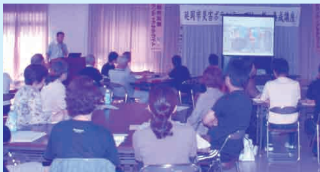
基礎編 平成26年6月22日(日) 9:00～12:00