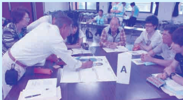
実践編 平成26年6月29日(日) 9:00～12:00

○会 場：延岡市社会福祉センター 3階大集会室（延岡市三ツ瀬町1丁目12番地4）