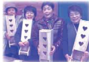
(前回は森の科学館で木工教室に参加しました)

日時：平成26年9月6日(土) 10:00～14:30(受付9:30～) 場所：ヘルストピア延岡 (社会福祉センターに集合後、送迎バスが出ます) 参加費：500円 募集人員：30名(先着順) 申込期間：7月28日(月)～8月15日(金) 申込/問い合わせ：本所 福祉サービス課