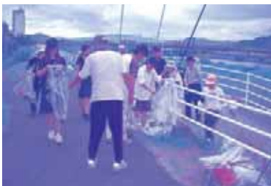
県下一斉ボランティア清掃の日

興味のある方は是非参加してください。お問い合わせは延岡市ボランティア協会へお願いします。個人ボランティアの募集もしております。是非ご登録をお願いします。