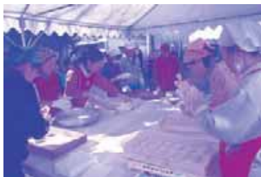
チャリティー福祉もちつき大会

興味のある方は是非参加してください。お問い合わせは延岡市ボランティア協会へお願いします。個人ボランティアの募集もしております。是非ご登録をお願いします。