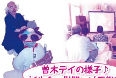
曾木デイの様子♪ 誕生会、慰問、映画鑑賞