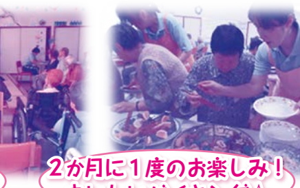
2か月に1度のお楽しみ! おいしいバイキング☆