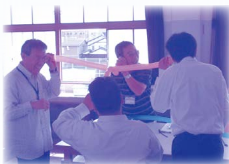
◇ 理科 実験教室 ◇

隊員さん達も子ども達から元気や感謝の笑顔をもらい、逆に励まされることも多いそうです。皆さんの生きがいづくりにも一役買っているはげまし隊です。是非、週に1回でも2回でも一緒に活動してみませんか？また、経済的に支えてくださる方も同時募集中です！