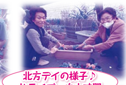
北方デイの様子♪ ドライブ、自由時間