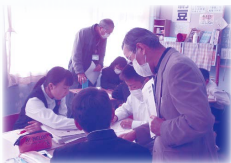
◇ 数学 授業支援 ◇

はげまし隊が活動を始めて今年で6年目を迎えます。現在、市内8つの中学校(旭、岡富、恒富、東海、土々呂、西階、延岡、南)にボランティアを派遣し、主に中学校一年生を対象として数学と理科の授業を支援しています。平成27年3月現在、ボランティア登録数は142名です。5月からは新たに北川中学校でも支援がスタートする予定です。