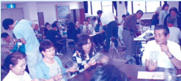
基礎編 平成28年6月12日(日) 9:00~12:00