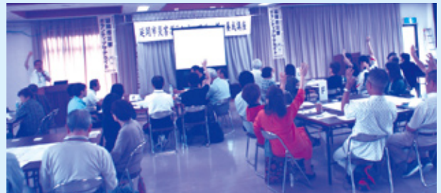
実践編 平成28年6月19日(日) 9:00~12:00