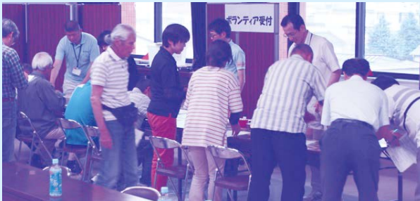
基礎編 平成29年6月11日(日) 9:00~12:00

今年度も下記日程において養成講座を開催しますので、皆さまの参加をお待ちしております。