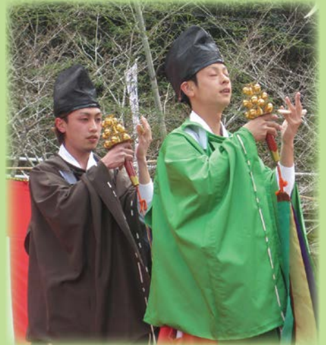
写真 三川内神楽まつり (三川内地区社協協賛行事)