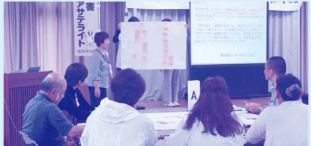
実践編 平成29年6月18日(日) 9:00~12:00