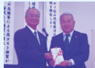
延岡地区遊技業組合