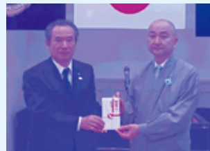
延岡ライオンズクラブ

延岡ライオンズクラブ様、延岡地区遊技業組合様より、ご寄付をいただきました。このご寄付は、地域福祉のために有効に活用させていただきます。ご協力ありがとうございました。