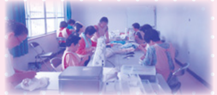
ひかり学園奉仕作業