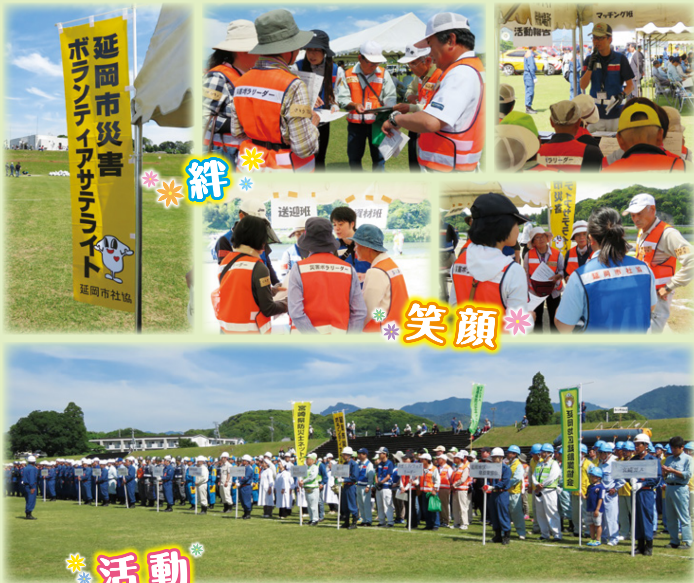
～ 延岡市水防訓練 ～