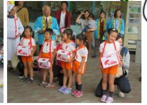
共同募金セレモニー