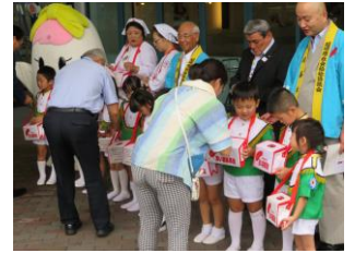
共同募金セシモニー