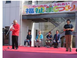
ふれあい福祉まつり