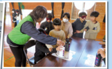
ハンディキャップ体験