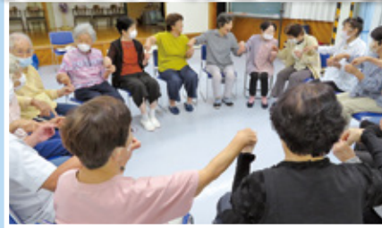
スリーA認知症予防リーダー活動