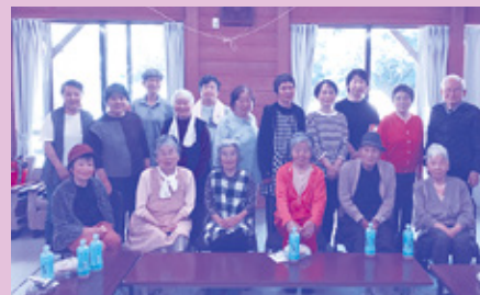
祝子川いきいきサロン(北川)

サロン活動に関してのお問い合わせや他サロンへの見学等の申し込みは、延岡市社協地域福祉課までご連絡ください。