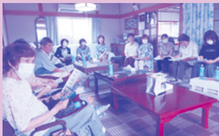
三須団地サロンCafe(恒富西)