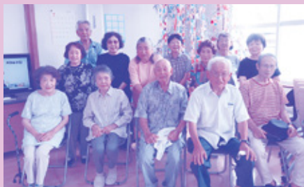
なかよし桜会(東海西)

延岡市内には7月末時点で133サロンあり、そのうち3サロンは、令和7年度に新規設立されました。今回はその3サロンの活動風景を紹介させていただきます。