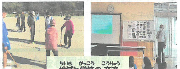
地域と学校の交流