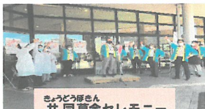
共同募金セレモニー

*在宅で生活している寝たきりの高齢者や障がいのある方へ民生委員児童委員さんがおむつを届けています。