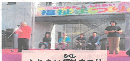
ふれあい福祉まつり